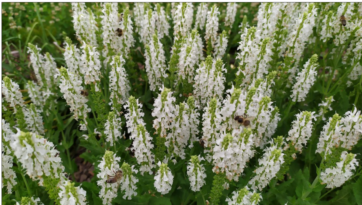
Šalvěj hajní Schneehügel